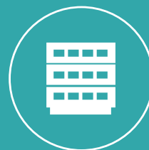
BASES DE DONNÉES DOCUMENTAIRES