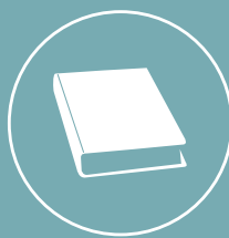
PAGES DE LIVRES