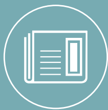
ARTICLES DE PRESSE