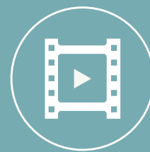
PROGRAMMES RADIO ET AUDIOVISUELS